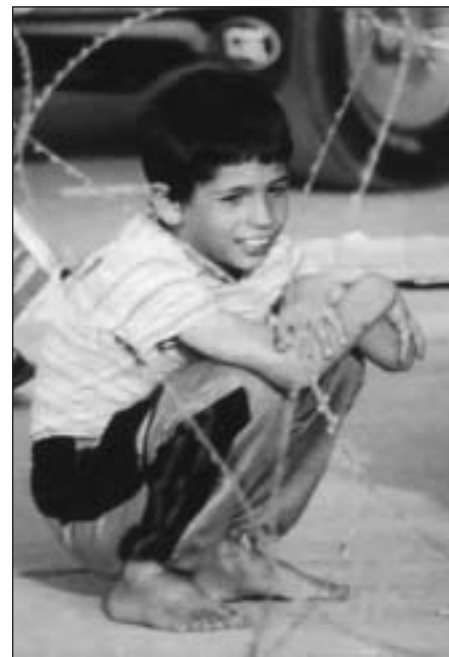
Chlapec v súčasnom Iraku

Z těchto příkladů vyplývá, že nemusíme dogmaticky stanovovat, kdy Duch svatý dar udílí. Je třeba se spíše zaměřit na využívání darů.