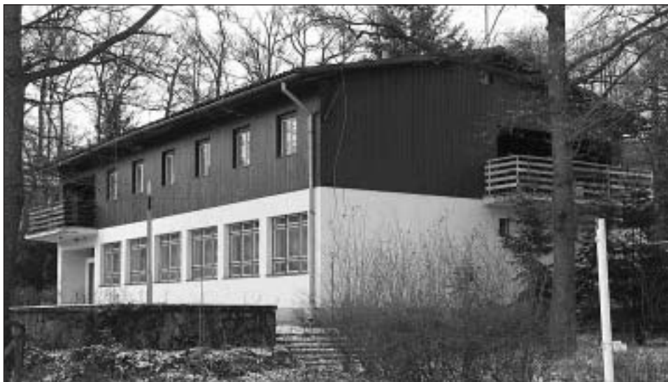
Chata v Harmónii

Vedeli sme, že tu v Harmónii sa naše dlhotrvajúce hľadanie objektu pre potrebnú a rozmanitú činnosť našich zborov končí. Ziala nás pocit hlbokého ubezpečenia, že táto vec je od Pána . Zvláštnou súčasťou odvíjajúceho sa kroku viery bola skutočnosť, že na budovu, ktorá mala stáť 4 milióny korún, sme nemali nič: ani korunu, ani sľuby podnikateľov, ani sľuby bohatých Angličanov či Američanov.