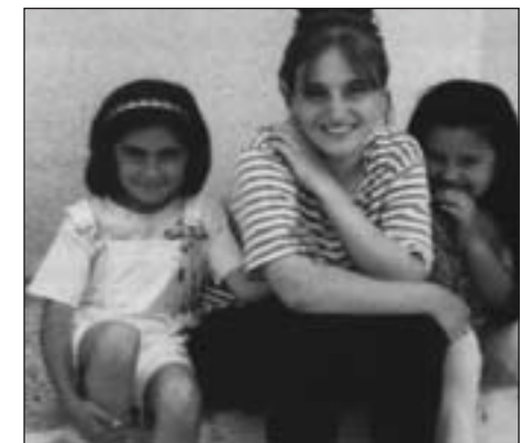
Iracká kresťanka s dcérami

Cez Vianoce 2003 a Nový rok došlo k záplave protikresťanského násillia po celom Iraku. Mnoho kresťanských kostolov a stredísk sa stalo terčom bombových útokov. Na Štedrý večer bol zastrelený kresťan, ktorý sa vracal z nákupov v obchode, aby slávil Spasiteľovo narodenie s manželkou a piatimi deťmi. Bol zabýty na verejnom mieste jedinou strelou do hlavy, ako keby bol popravený.