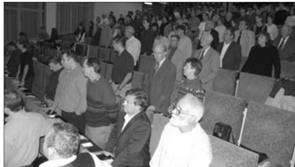
Účastníci tohtoročnej misijnej konferencie v Harmonii

Je spousta dalších zákonů, které jsou limitovány věkem (vedle výše uvedených je to např. volební právo, držení zbraně, výherní automaty, řízení motorových vozidel, sňatky,...).