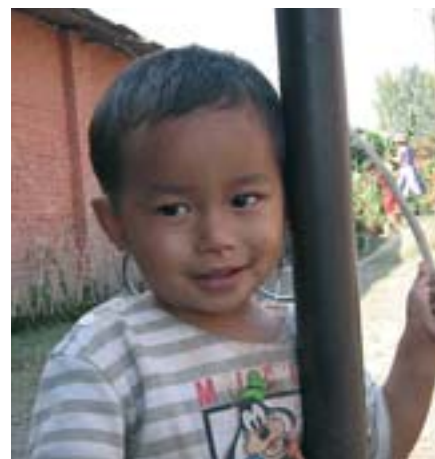
■ Úsměv místního chlapce

V úterý 4. 10. jsme A..., A... a já časné ráno vyrazily na autobusové nádraží.