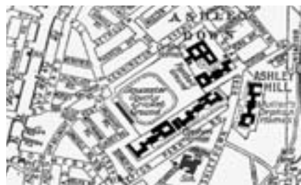
■ Obrázky a mapa sirotčinců

s Craikom Ustanovizeň pre šírenie poznania Písem doma i v zahraničí . Bola to miniatúrna biblická spoločnosť. Jej účely boli (1) pomáhať pri zakladaní denných, nedeľných a večerných kresťanských škôl pre deti a dospelých, (2) rozširovať Biblie a Nové zákony a (3) podporovať misijné úsilie súhlasné s novozákonnými princípmi. Pri dosahovaní uvedených účelov sa obaja muži zaviazali dodržiavať 7 princípov, navrhnutých Müllerom, ktoré považovali za biblické.