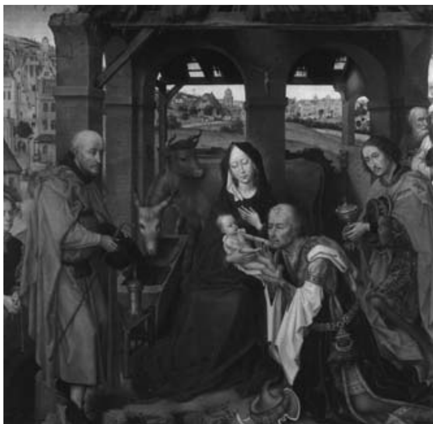
■ Vyzývání králů, Rogier van der Weyden, 1455

Zasažení Božím Slovem, jež se v jeslích stalo člověkem, nevycházejí z úža-