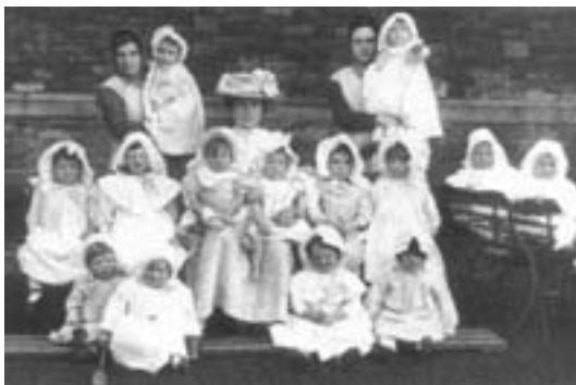
■ Oddelení péče o nejmenší děti

15-mesačného syna) pri novom čítaní životopisu A. H. Franckeho oživila sa v Müllerovi znova stará myšlienka. Dôverne poznal Franckeho ústavy v Halle (založené v roku 1696), ba krátky čas v jednom z nich ako chudobný študent býval. Povzbudený Písmom, ktoré si čítal (Ž 81,11), cítil Božie vedenie, aby začal podobnú prácu pre siroty, opustené a chudobné deti v Bristole. Bolo mu ľúto takýchto detí v Bristole – túžil po ich záchrane pre večnosť ale i po pomoci pre ne v ich časej biede. Prial si, aby z nich vyrástli opravdiví kresťania a kresťanky a tým aj užitoční ľudia v spoločnosti. A tak, nežiadajúc peniaze ani iné prostriedky od ľudí, ale iba od Boha, začal Georg Müller bez prostriedkov, ale v úplnej dôvere v Boha, toto dielo, ktoré sa malo rozrásť do nevídaných rozmerov.