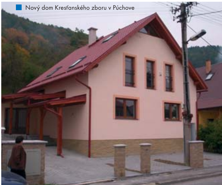
■ Nový dom Kresťanského zboru v Púchove