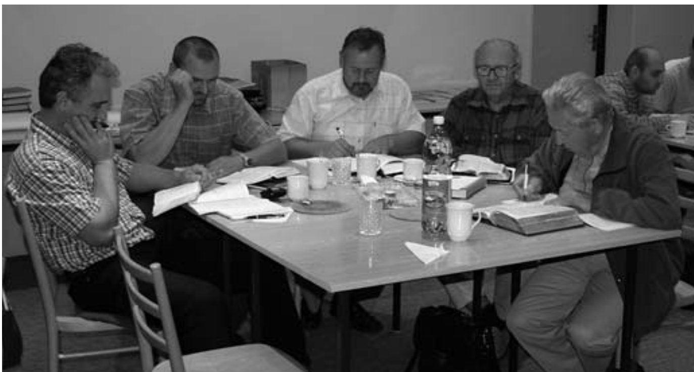
■ Biblický kurz pre zborových pracovníkov v Nitre