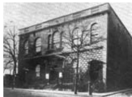
■ Kaple Bethesda v Bristolu