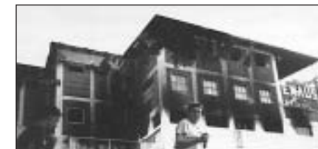
Budova Emmaus centra po požiar

4. januára 2003 vypukol požiar v budove Emmaus centra. Zničil asi 90% jej obsahu, ale i strechu a drevené výplne stien 2. a 3. podlažia. V apríli však už bola už budova opravená a sfunkčnená z 80% i vďaka ochotnej finančnej pomoci veriacich z rôznych strán.