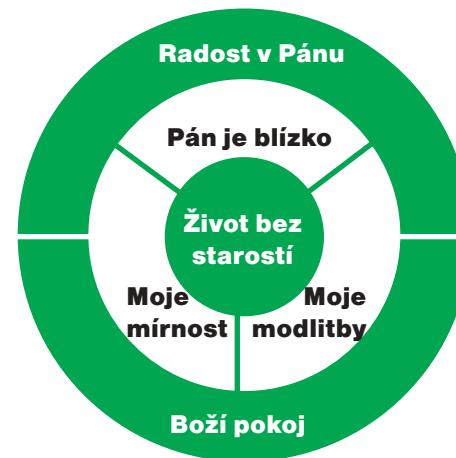
Ochranná pásma podle Fp 4,4-7

Jakoby to byla dvě „ochranná pásma“, díky kterým se starosti z vnějšího prostředí neuhníží v našem nitru, jak je možno vyzorovat z grafického znázornění: