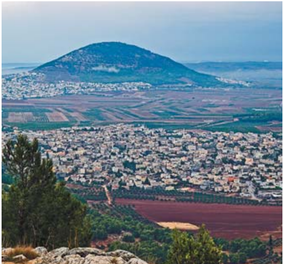
■ Hora Tabor a Jezreelská rovina

V celém Starém zákoně platí zvláštní Boží péče zejména chudým, cizincům a příchozím (Dt 15,4-11; Ž 72,13; Př 19,17). Bylo to brímké, které v srdci nosili i proroci (Iz 3,15; 10,2; Jr 5,28; Ez 16,49; Da 4,24; Am 5,11-12; Za 7,10). Není tedy divu, že čteme už v Jakubově listu židokřesťanům: „Čisté a neposkvrněné náboženství před Bohem a Otcem je toto: