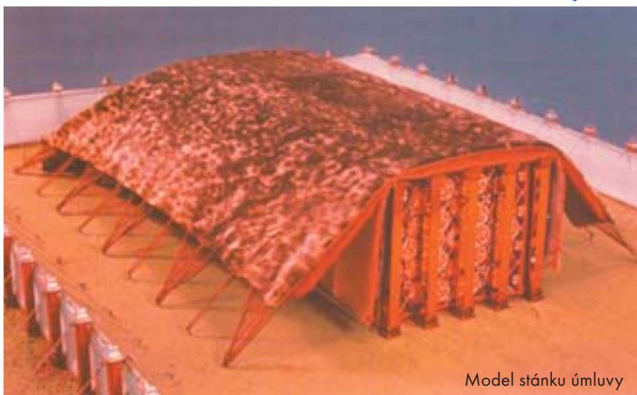
Model stánku úmluvy

Tazatel: Dovolte mi několik otázek. V táboře vládne velký rozruch, co se zde vlastně stalo?