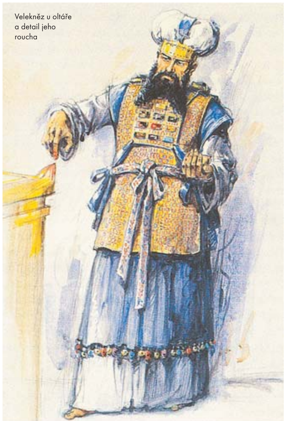
Velekněz u oltáře a detail jeho roucha

neví rady, nepozná jeho hlas – musí se to nejprve naučit (1S 3,7). A učit se to může jen od Hospodina, jen nasloucháním Hospodinu. Všim, co až dosud prožil, se stává pro Hospodinovo slovo vnímavým a pro Hospodina použitelným: chováním jeho matky, pobytem ve svatyni od útlého mládí a nakonec Hospodinovým promluvením. Tím, že naslouchá (nikoli mluví) umožňuje Hospodinovo promluvení k lidu. To ostatně vyjadřuje i šestý význam jeho JMÉNA, rozumíme-li mu od slovesa ja-l: Ten, který se podvoluje, umožňuje Bohu (mluvit). A Samuel naučí se rozpoznat a rozumět Hospodinu (zraje)