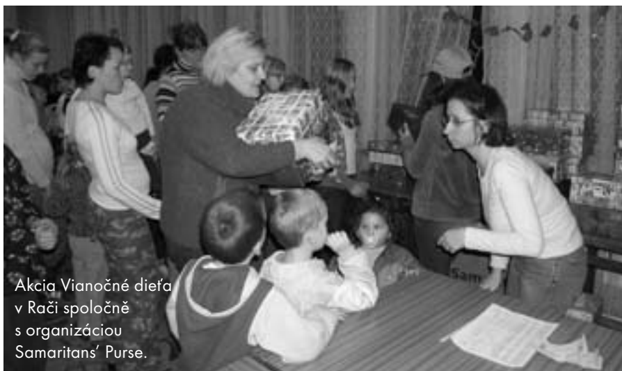
Akcia Vianočné dieťa v Rači spoločne s organizáciou Samaritans' Purse.

Z vlastnej skúsenosti som presvedčený, že to možné je a opakujúca sa