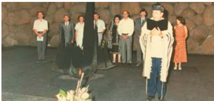
■ Udělení vyznamenání na Herzlově vrchu ve vzpomínkové hale Ohel Jizkor

Za udělené vyznamenání jsem směl poděkovat v budově Jad Vašem. Odpověděl jsem především na otázku, proč rodiče zachránili židovskou rodinu. Připomněl jsem slova Pána Ježíše Samařance: „Spasení je ze Židů“. Nikdy by moji rodiče, ani já a mnoho tisíců křesťanů nepoznali živého a pravého Boha, který je Bohem Izraele, kdyby Pán Ježíš nezemřel na Golgotě a vstal z mrtvých.